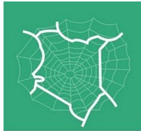
PeaceNet - Kenya

PeaceNet Kenya est un réseau national d'ONG, d'organisations européennes d'aide, d'organisations religieuses et de personnes investies dans la construction de la paix et la résolution de conflits par la recherche, le plaidoyer, la formation, le développement de capacités, le partage d'informations, la documentation et la supervision/réponse rapide. PeaceNet est engagé à encourager la collaboration, la facilitation, et la mobilisation d'initiatives locales pour la construction de la paix, la promotion de la justice et la résolution de conflits.